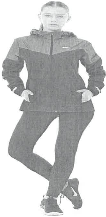
MODELO DE CASACA (116 UND) 116 UNIDADES

Handwritten signature or mark in blue ink.