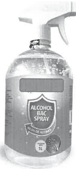
IMAGEN REFERENCIAL DEL BIEN