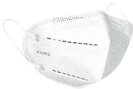
IMAGEN REFERENCIAL DEL BIEN

DESCRIPCION GENERAL: Modelo: mascarilla plegable (KN-95) Material médico que cubre la boca y la nariz y que proporciona una barrera para minimizar la transmisión directa de agentes infecciosos entre el usuario y el ambiente.