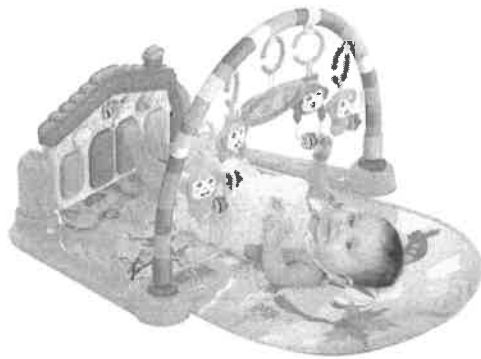
GIMNACIO DE ESTIMULACIÓN PARA BEBÉ