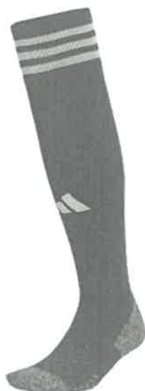
Medias: Color Vino con 03 francas plomo plata