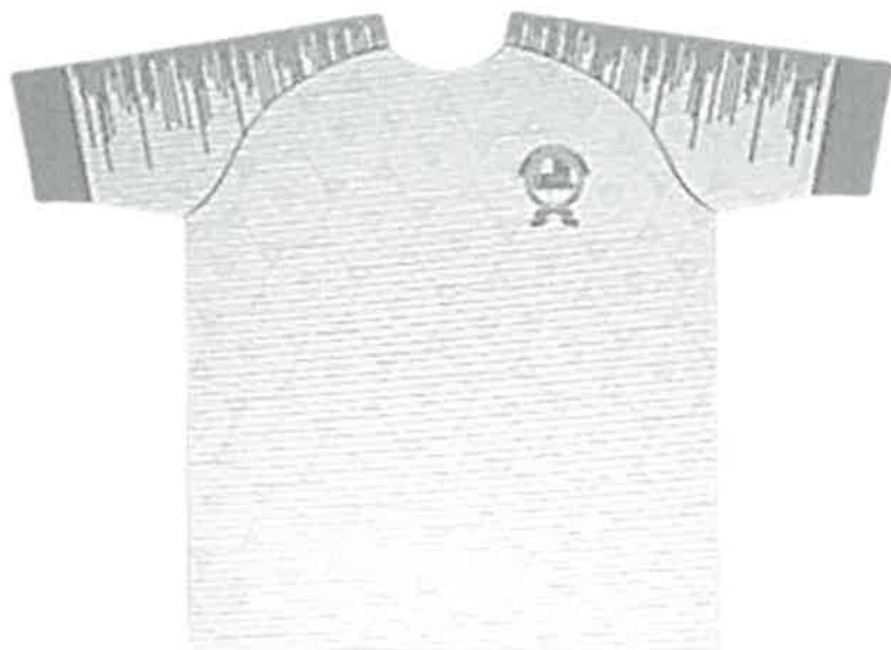
Camiseta: Color plomo plata con diseños en color vino