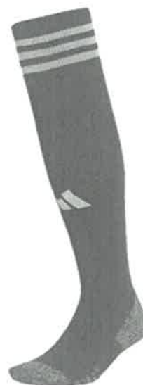
Medias: Color Vino con 03 francas plomo plata