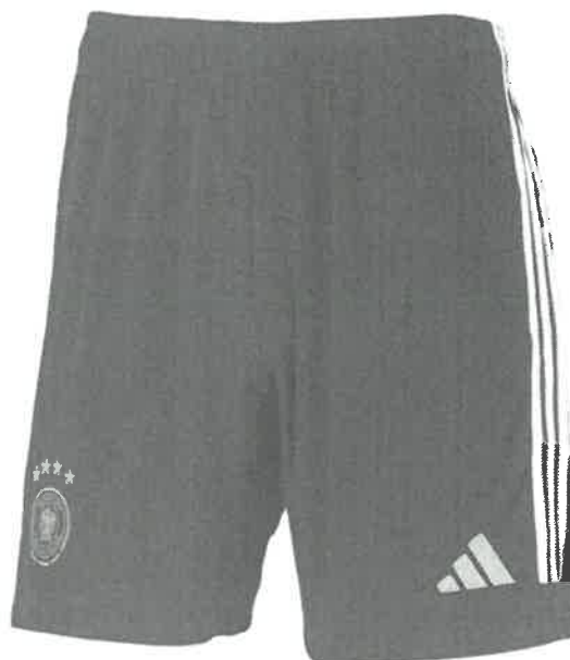
Short: Color Vino con 03 francas plomo plata