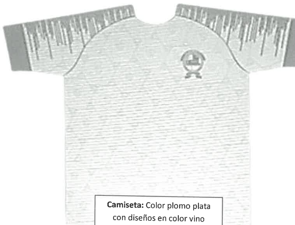
Camiseta: Color plomo plata con diseños en color vino