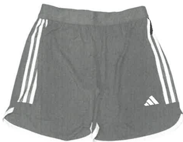
Short: Color Vino con 03 francas plomo plata